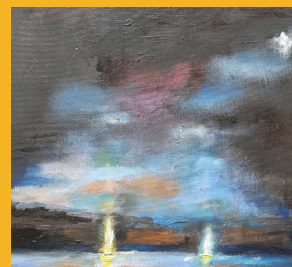
Schilderij: Trija Fleer- Niks

Ik wens u een dag met goede zin. Tanja Schoep